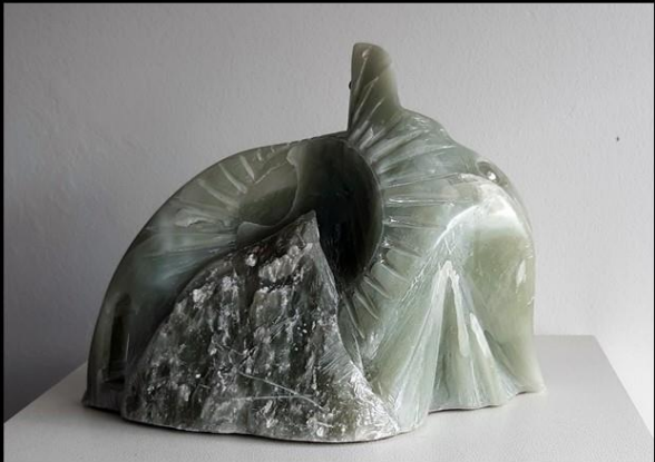
Stéatite, perle et pâte de verre, Bois et métal