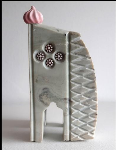
Stéatite, perle et pâte de verre, céramique