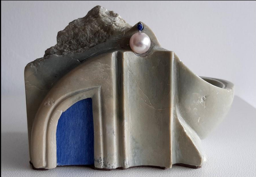
Fontaine au Grand Jamais