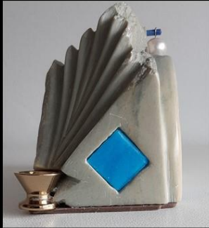
Stéatite, perle plastique et pâte de verre, Bois et métal