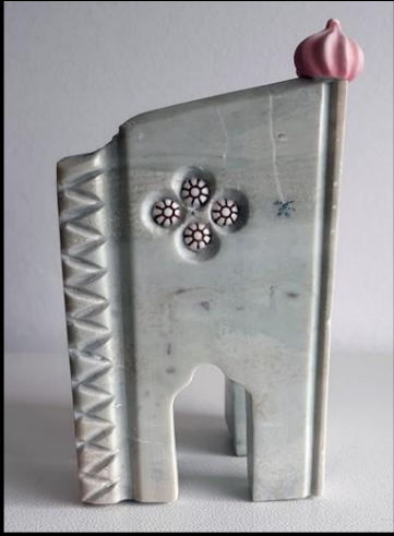
Porte des 4 Courants d'Air