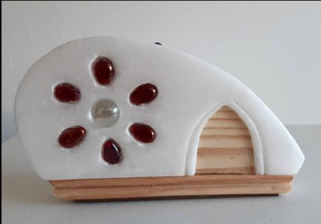
Dispensaire du Ménage et de Ses Soins