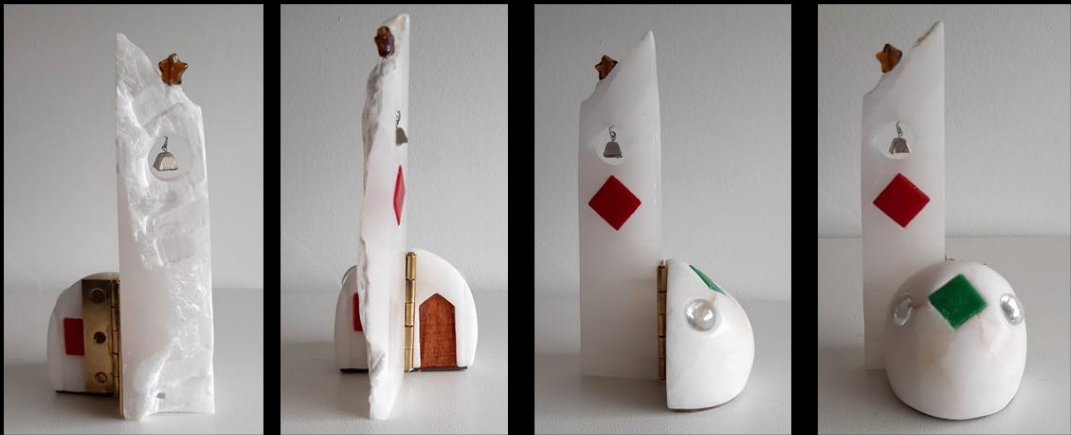
Stéatite, perle et pâte de verre, Bois et métal