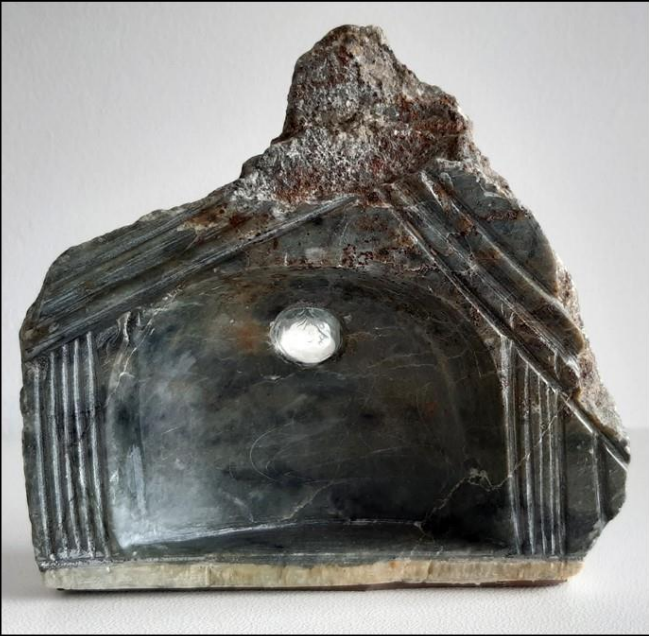
Stéatite, perle de verre