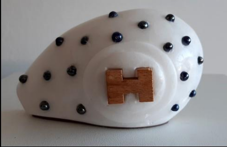
Albâtre, perle et pâte de verre, Bois